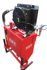
SERBATOIO 40 LT. MOBILE