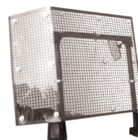
PROTEZIONE RETE + LEXAN