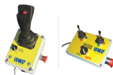
JOYSTICK E SCATOLA COMANDO