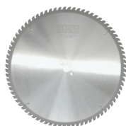
DISCO PER TAGLI A SECCO