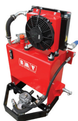
SERBATOIO 40 LT. FISSO